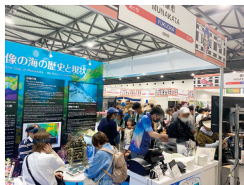
開催中は来場者で大盛況