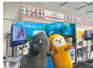
黒子のイカ・むなかたのテンちゃんも 応援に来場