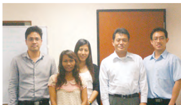
タイ高田のメンバー（右から2人目が廣橋社長）