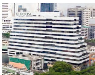
事務所が入居する Q-HOUSE ビル